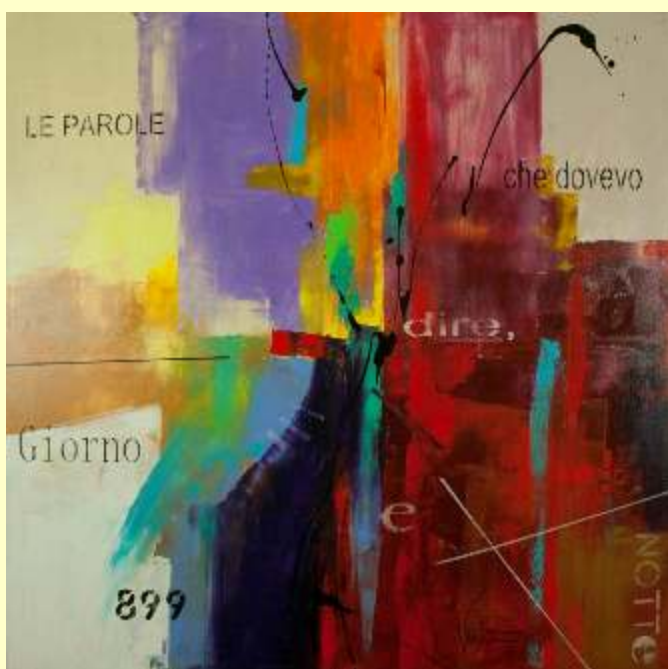
Lotto 42 DINO VENTURA Corato, 1962 "Le parole che dovevo dire di giorno e notte" anno 2017 acrilico spatolato e dripping di bitume su tela 115x115 cm firmato e datato al retro Autentica dell'Autore