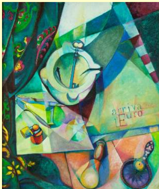
Lotto 80 PAOLA BERETTA La Spezia, 1948 "Arriva l'€" anno 1998 olio su tela 60x50 cm firmato e datato al retro