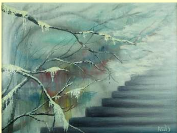
Lotto 49 NATALIA CARAGHERGHI Moldavia, 1979 "Sotto l'occhio di Odino" anno 2016 olio su tela 60x80 cm firmato al fronte, al retro Certificato di autenticità dell'Artista