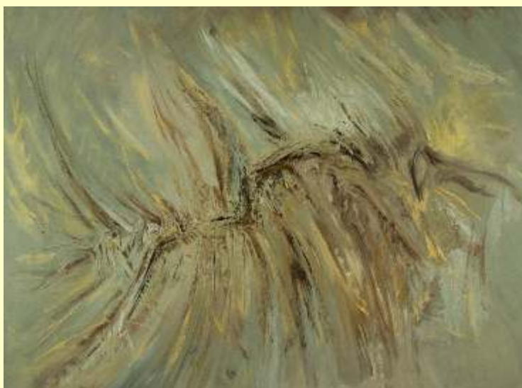
Lotto 63 IORELLA MANZINI Bologna, 1942 "Frattura" anno 2011 acrilico e colori ad olio su tela 60x80 cm firmato e titolato al retro