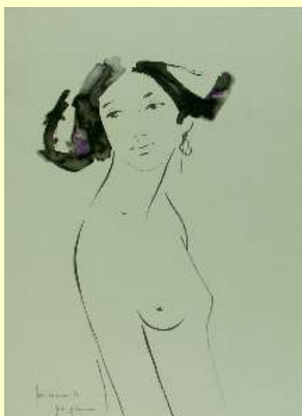
Lotto 109 MARIO PIERGIOVANNI "Primavera" anno 1971 guazzo su carta 70,5x50,5 cm firmato, datato e titolato al fronte