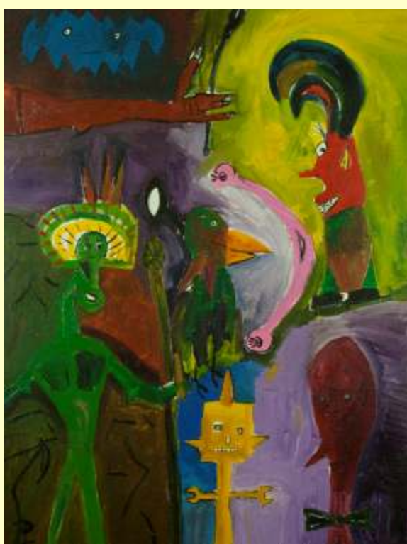
Lotto 66 LUCA PINELLI Sarzana, 1980 "Disarmonia della vita magica" anno 2015 olio su tela 80x60 cm Al retro titolo, data e firma