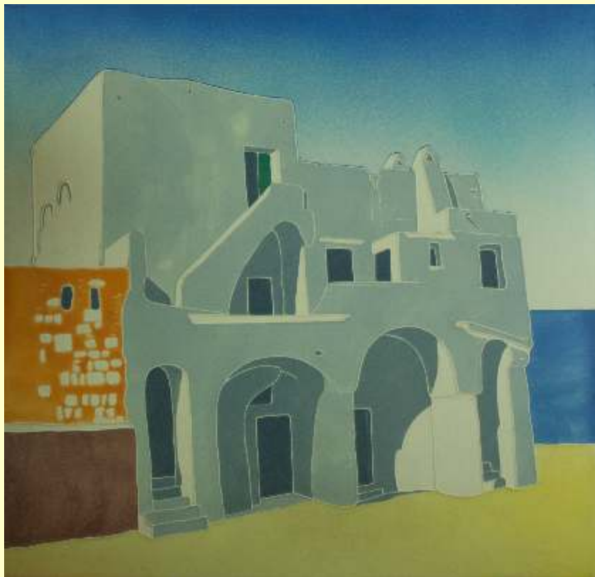
Lotto 7 TASTARDI Salerno, 1967 "Abitazione del golfo" acquerello su ceramica 56x58 cm Firmato sul profilo in legno che lo circonda e al retro Autentica del Maestro