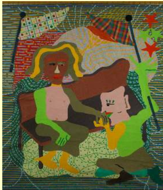
Lotto 76 ELVIO MIRESSI Foggia, 1960 "Essenza di un bacio" anno 1999 olio, acrilico e stoffe su tela 100x87 firmato, titolato e datato al retro