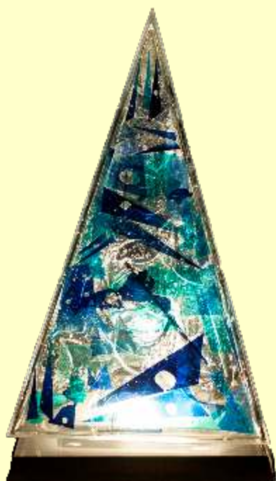
Lotto 71 RODOLFO FINCATO Abano Terme, 1947 "Piramide blu" scultura in plexiglass 53x30x30 Cerificato del Maestro