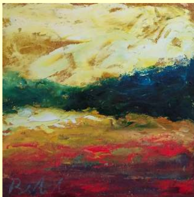
Lotto 90 FRANCESCO BITONTI San Giovanni in Fiore "Paesaggio introspettivo" olio su sughero 30x30 cm firmato al fronte Certificato del Maestro