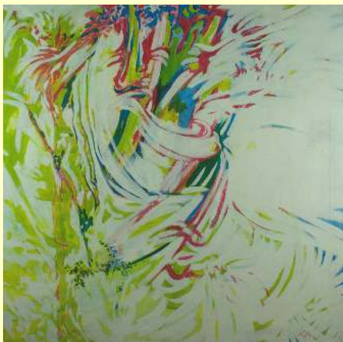
Lotto 45 MICHELE PINTO Grumo Apula, 1950 "Catarsi" anno 1995 olio su tela 100x100 cm firmato e datato al fronte; al retro etichetta dell'Artista