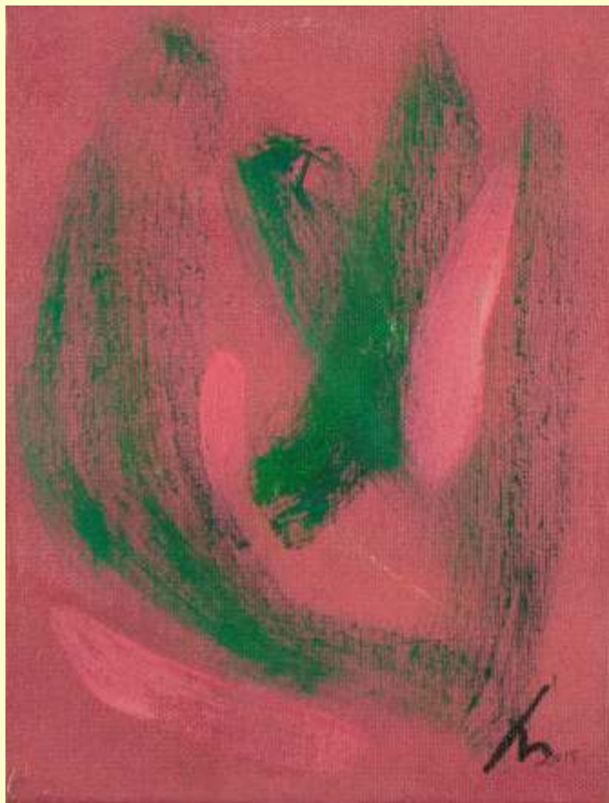
Lotto 10 VILMA LANDRO Parghelia, 1957 "Astratto" anno 2015 olio su tela 24x18 cm firmato e datato al fronte; al retro etichetta dell'Artista