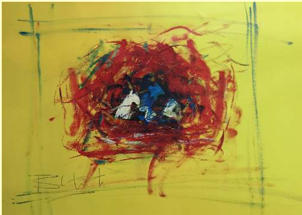
Lotto 101 FRANCESCO BITONTI San Giovanni in Fiore "Senza titolo" olio su carta 50x70 cm firmato al retro Certificato del Maestro