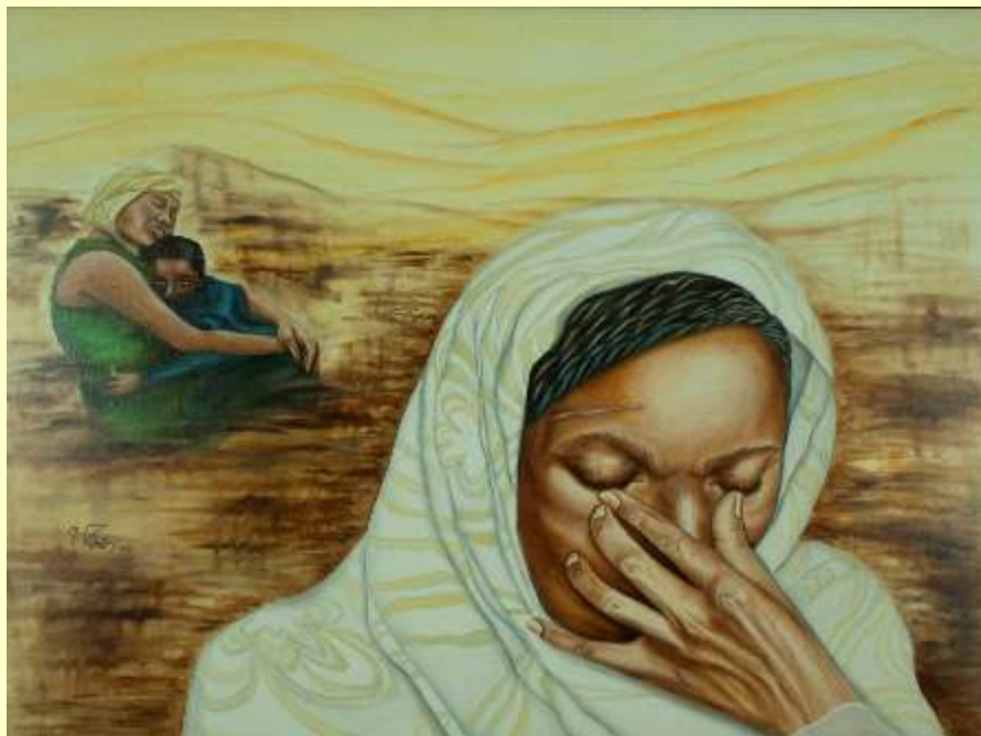
Lotto 13 IMMACOLATA ZABATTI - Monte lasi, 1962 "La Misericordia" - anno 2016 - olio su tela - 60x80 cm firmato, datato al fronte; al retro titolo, firma e anno + 3 etichette dell'Artista