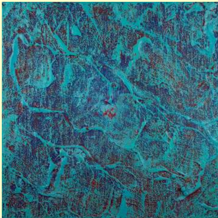
Lotto 60 CHIARA MARESCA Napoli, 1950 "EDGE" - anno 2012 (omaggio a Sylvia Plath dalla serie DONNE ) Resina, cristalli e acrilico su tela 60x60 cm Al retro Certificato dell'Artista