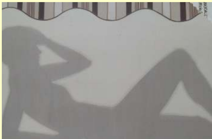
Lotto 81 MARA FESTARI Borgomanero, 1979 "Al sole" olio su tela 80x120 cm Certificato dell'Artista