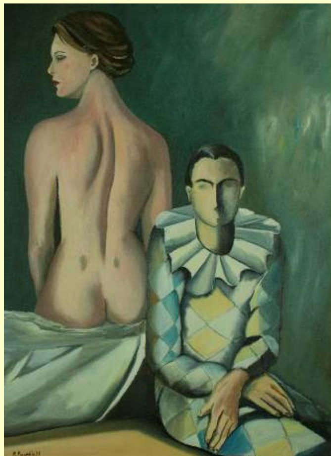
Lotto 11 ROBERTA PISANELLO Lecce 1947 "Enigma dell'essere e dell'apparire" anno 1992 olio su tela 70x50 cm firmato e datato al fronte; al retro firma, data ed etichetta dell'Artista