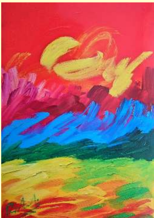
Lotto 100 FRANCESCO BITONTI San Giovanni in Fiore "Concetto introspettivo" olio su tela 70x50 cm firmato al retro Certificato del Maestro