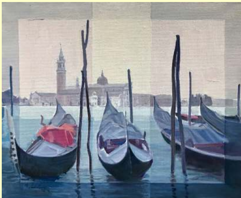
Lotto 110 quater FRANCESCO SICLARI Villa San Giovanni, 1940 "San Giorgio- Venezia" anno 2017 olio su tela 60x50 cm firmato e titolato al fronte