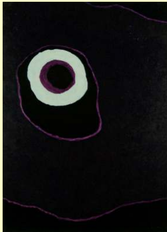
Lotto 61 VERA CARBONE Minervino Murge "Eclissi" - anno 2006 olio su tela - 70x50 cm firmato al fronte; al retro titolo, data e firma