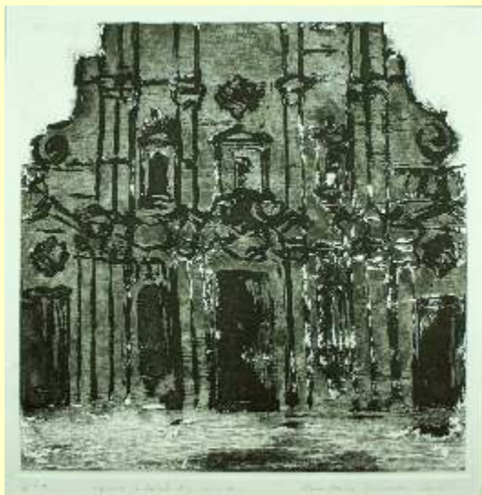
Lotto 37 ANNAMARIA CALAMANDREI Pergola, 1936 "Havana, la Catedral" es n. P.d.A. anno 2011 incisione originale maniera zucchero, acquaforte acquatinta 50x50 incisione firmato, intitolato e datato al fronte; al retro etichetta dell'Artista