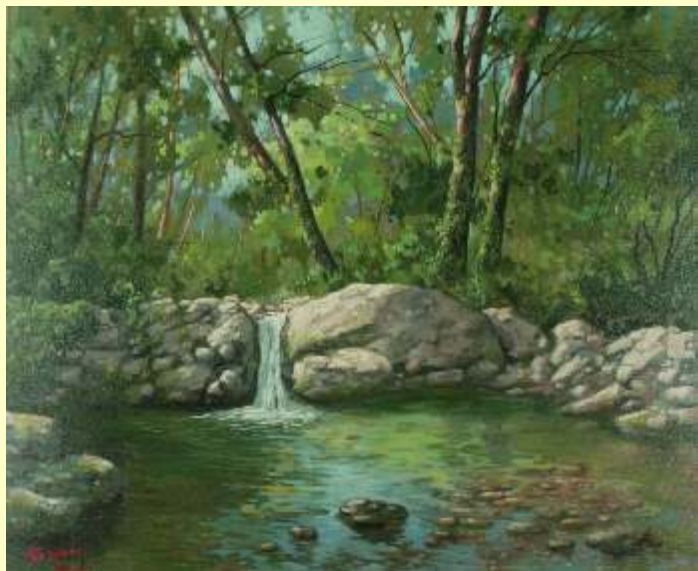
Lotto 25 LUCIANO TIGANI Polistena, 1966 "Ruscello" anno 2017 olio su tela - 50x60 cm firmato al fronte e al retro. Autentica del Maestro.