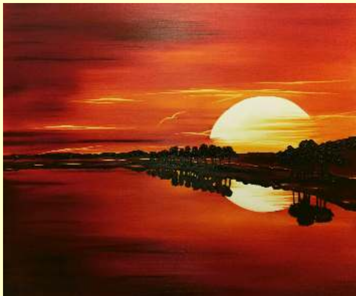
Lotto 79 RURÒ Barletta, 1964 "Essenza" anno 2017 olio su tela 100x120 cm firmato al fronte; al retro titolo, firma e data