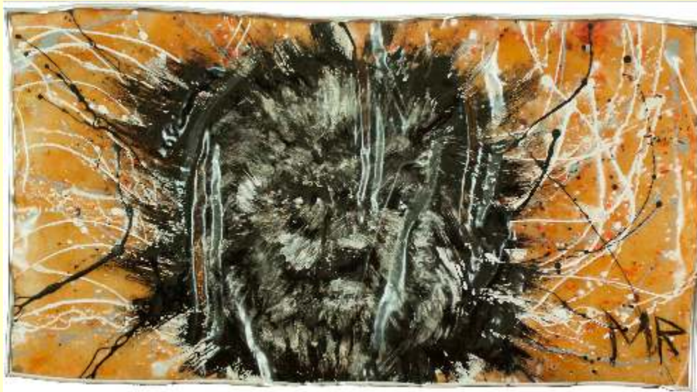
Lotto 64 MARCO RAFFAELE Catanzaro, 1984 "Licantropia" gelcoat e vetroresina 44x80 cm firmato al fronte