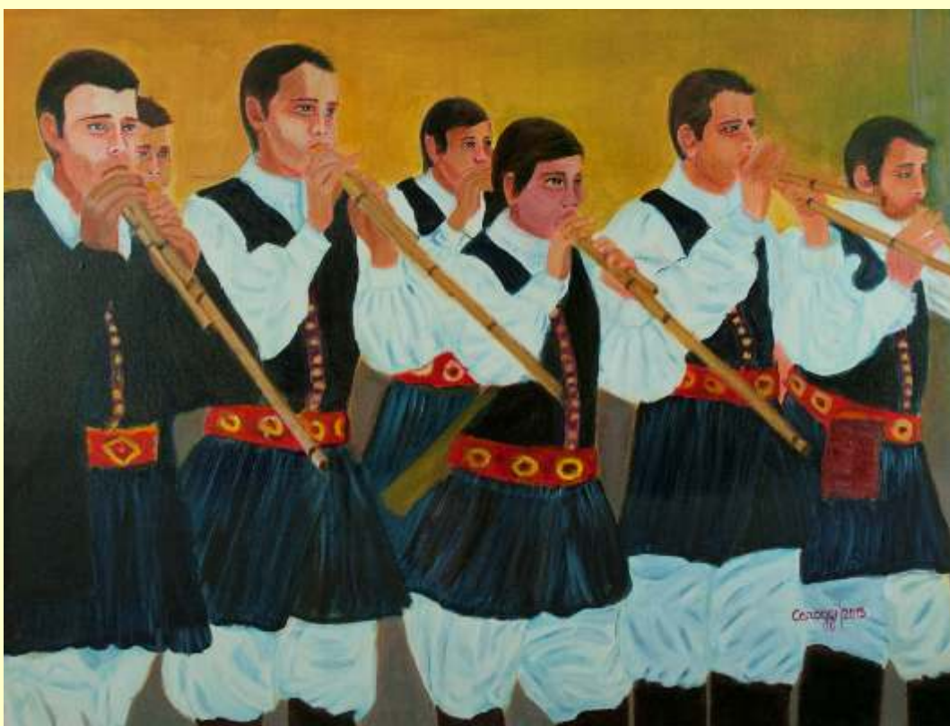
Lotto 110 bis CAROGGI - Sagama, 1950 "Suonatori di Launeddas" - anno 2015 acrilico su tela - 60x80 cm firmato e datato al fronte; al retro etichetta dell'Artista