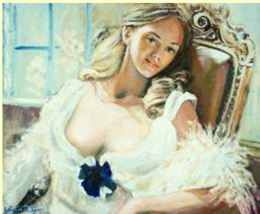
Lotto 36 GRAZIELLA PARLAGRECO Alessandria, 1936 "Romantica debuttante" anno 2017 olio su tela 50x60 cm firmato e datato al fronte; al retro etichetta dell'Artista