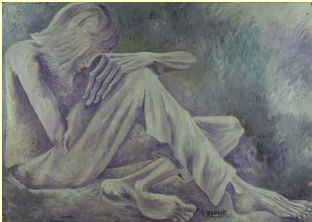
Lotto 107 MARALBA FOCONE Napoli, 1946 "Come le canne: il vento" olio su cartone 73x103 cm firmato al fronte; al retro firma e titolo