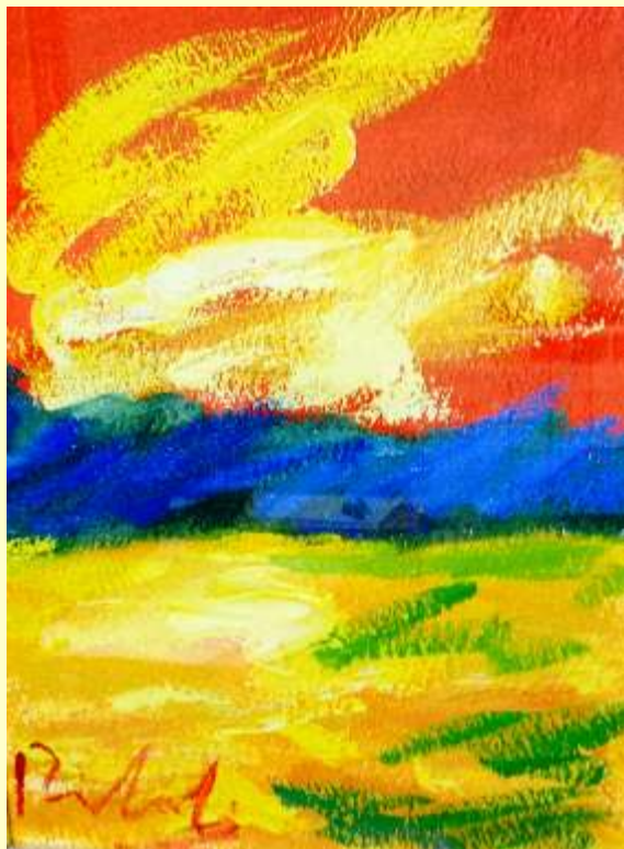
Lotto 89 FRANCESCO BITONTI San Giovanni in Fiore "Paesaggio introspettivo" olio su carta 50x30 cm firmato al fronte Certificato del Maestro