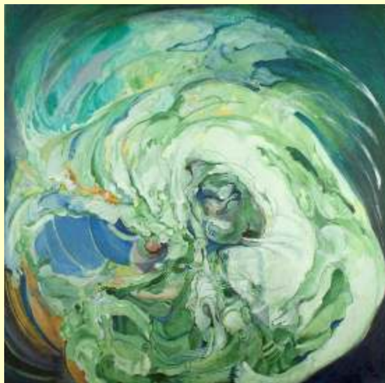
Lotto 47 MARGHERITA LIZZINI Milano, 1933 "L'ondata" anno 2008 acrilico su tela 100x100 cm firmato e datato al fronte; al retro firma, data titolo + etichetta dell'Artista