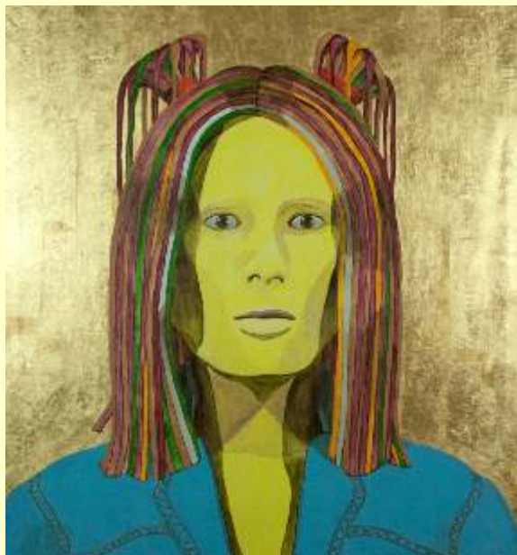
Lotto 1 ENRICO DEL ROSSO Trieste, 1967 "Extrameus" anno 2017 Tecnica mista su tela 84x77cm firmato al fronte Autentica del Maestro