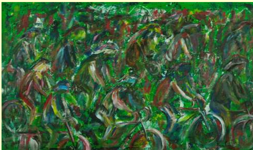
Lotto 12 ROCCO SANTORO Ceglie Messapica, 1960 "Passeggiata ciclistica" anno 2011 acrilico su tela 60x100 cm firmato e datato al fronte; al retro firma, anno titolo + etichetta dell'Artista