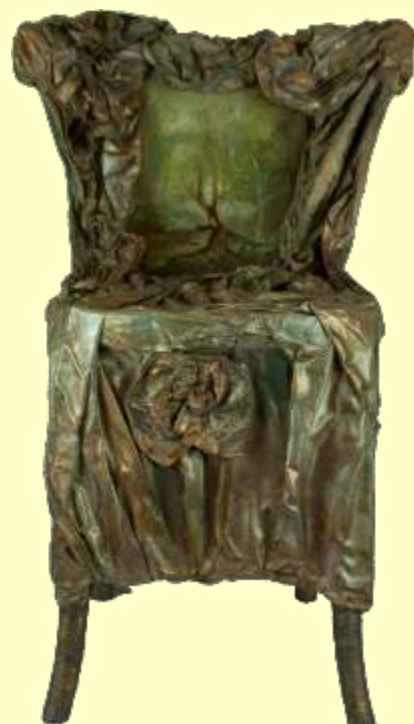
Lotto 70 DANIELA de SCORPIO Roma, 1947 Sedia parlante "La romantica" pittoscultura 80x50x40 cm firmata sul dorso