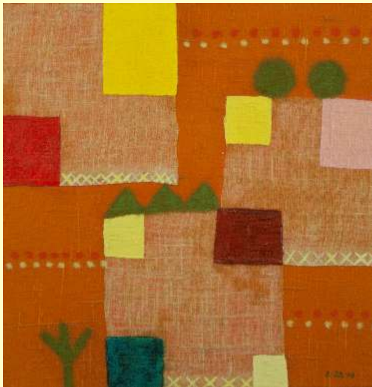
Lotto 57 DAVIDE BARBANERA Città di Castello, 1969 "Giardino d'infanzia" anno 2008 collage, olio e pastello su tela applicata su tavola 31x30 cm firmato e datato al fronte; al retro titolo e data