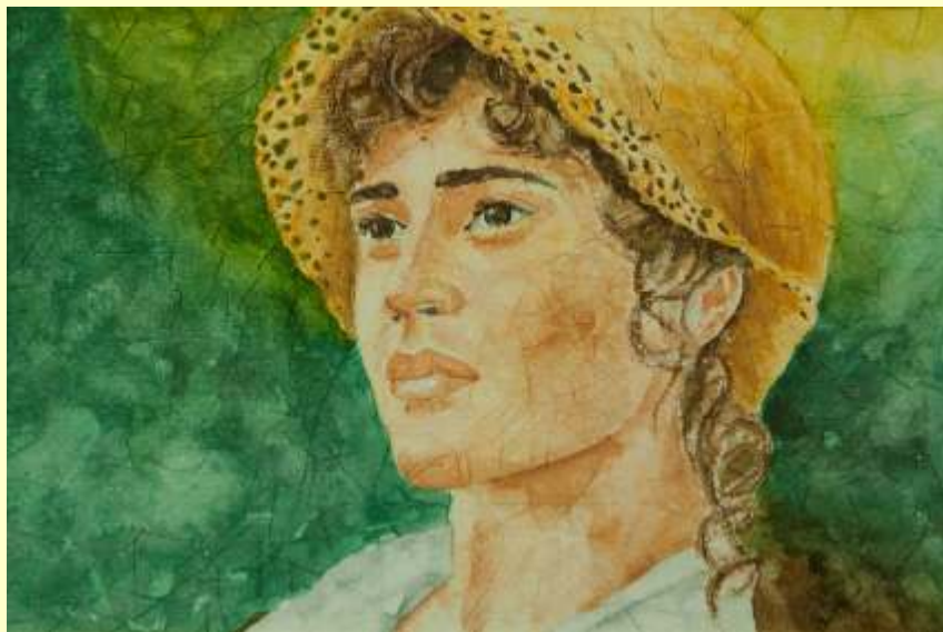
Lotto 72 ANNARITA LONGO Latiano, 1971 acquerello su carta Fabriano 400 g anno 2011 19x29 cm firmato e datato al fronte