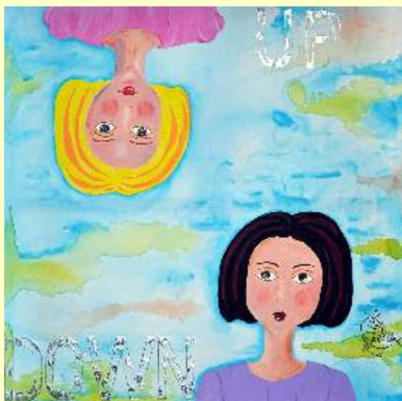
Lotto 103 MINA CAPPUSSI Bojano, 1962 "Up & down" anno 2016 acrilico su tela 100x100 cm firmato al fronte; al retro Certificato dell'Arista