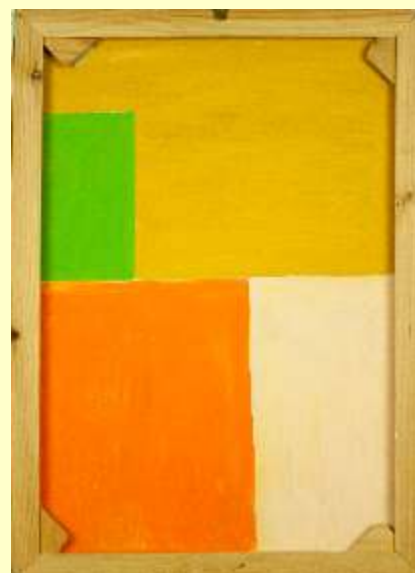
Lotto 4 (retro)

Lotto 5 NICOLETTA LEMBO Castagneto Carducci, 1965 "Pagliaccio" Tecnica mista olio e acrilico 40x50 cm firmato al fronte e al retro. Autentica dell'Artista.