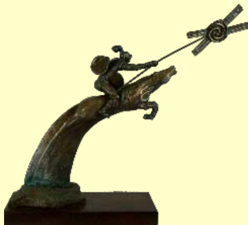
Lotto 68 NIETTA D'ATENA Reggio Calabria, 1942 "Don Chisciotte vincente" anno 2010 scultura in bronzo 55x70x 17 titolo e data sul dorso; sotto la base Certificato dell'Artista