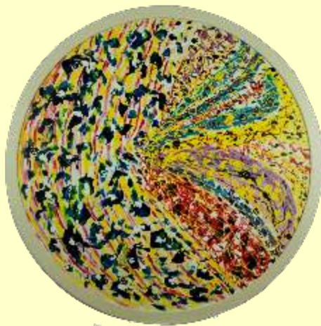
Lotto 75 FEDORA SPINELLI San Severo, 1942 "Forza d'urto" anno 2012 tecnica mista su tela ø 80 firmato al fronte al retro certificato dell'Artista