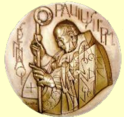
Lotto 99 FLORIANO BODINI Gemonio 1933 – Milano, 2005 "Ioannes Paulus II" multiplo es n. 14/675 scultura in lega speciale di metallo Ø 24 cm firmata Certificato del Maestro