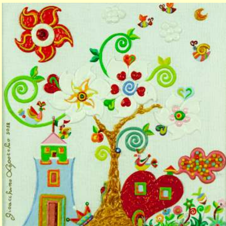
Lotto 31 GIOACCHINO LOPORCHIO Cerignola, 1960 "L'albero d'oro" anno 2012 olio su tela 20x20 cm firmato e datato al fronte; al retro titolo, misura e firma e dedica