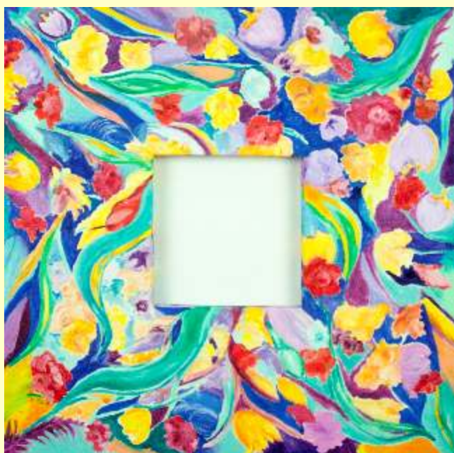
Lotto 3 ANTONIETTA LOSITO Melfi, 1951 "Fantasia" anno 2016 olio su tela 60x60 cm firmato, titolato e datato al retro; Autentica dell'Artista