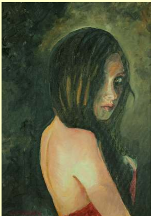
Lotto 15 CAROLINA FERRARA Vigevano, 1963 "Red Hornet" anno 2011 olio su tela 45x35 cm firmato al fronte; al retro firma ed etichetta dell'Artista