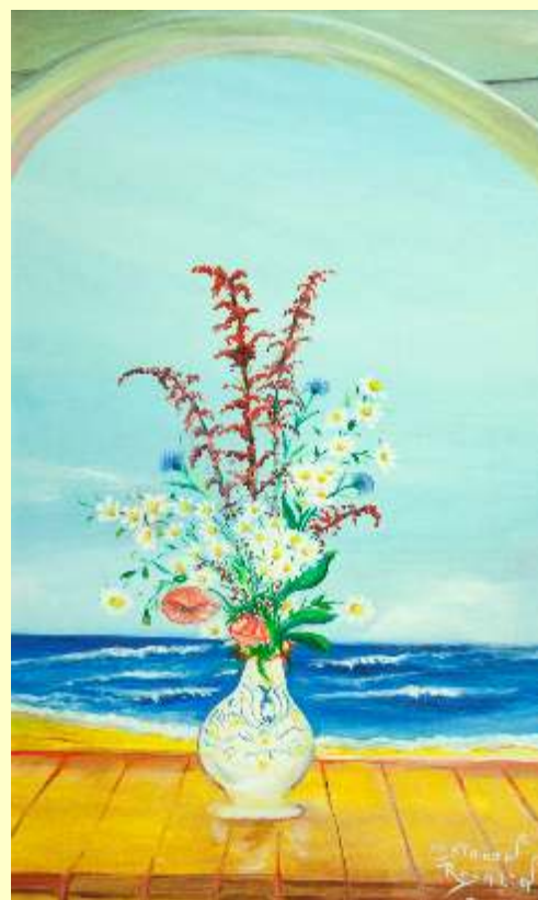
Lotto 58 COSTANZA ROSALIA Termini Imerese, 1955 "Ogni cosa è vanità" anno 2016 olio su tela 50x30 cm firmato e datato al fronte; al retro firma, titolo e data e Certificato dell'Artista