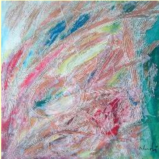
Lotto 98 PIER PAOLO NUDI Cosenza, 1971 "Evanescenza" tecnica mista 70x50 cm firmato al fronte Certificato del Maestro