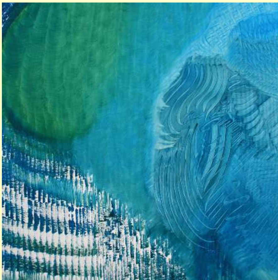
Lotto 110 ter GLENDA DOLLO Catania, 1980 "Drawing" anno 2011 olio su tela 60x60 cm Firmato e datato al retro