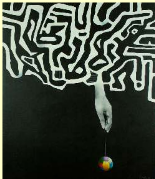
Lotto 77 VITO DISTANTE Francavilla Fontana, 1958 "Enigmatic game" anno 2014 acrilico su tela 70x60 cm firmato e datato al fronte; al retro firma + timbro dell'Artista